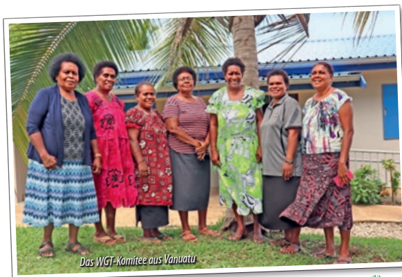
Das WGT-Komitee aus Vanuatu

Dazu laden uns die Frauen aus Vanuatu ein: an Althergebrachtem zu rütteln, uns neu zu vergewissern, ob das Haus unseres Lebens auf sicherem Grund steht oder ob wir nur auf Sand gebaut haben. Feiern Sie diesen herausfordernden Gottesdienst mit uns und Millionen von Frauen, die sich am ersten Freitag im März die Hände reichen über Konfessions- und Ländergrenzen hinweg und den Lobgesang auf Gottes wunderbare Schöpfung anstimmen und um Frieden beten.