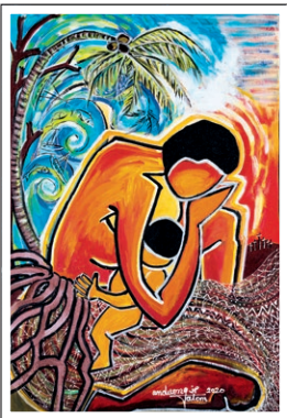
Titelbild des Weltgebetstags 2021 von Juliette Pita

Handeln allerdings müssen wir jeden Tag.